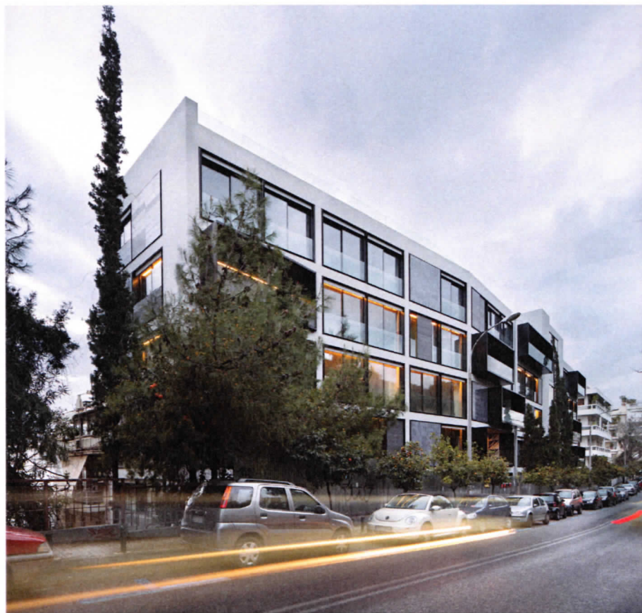
Εικ. 3 Κλιμακωτή διάταξη όγκων κπρίου.