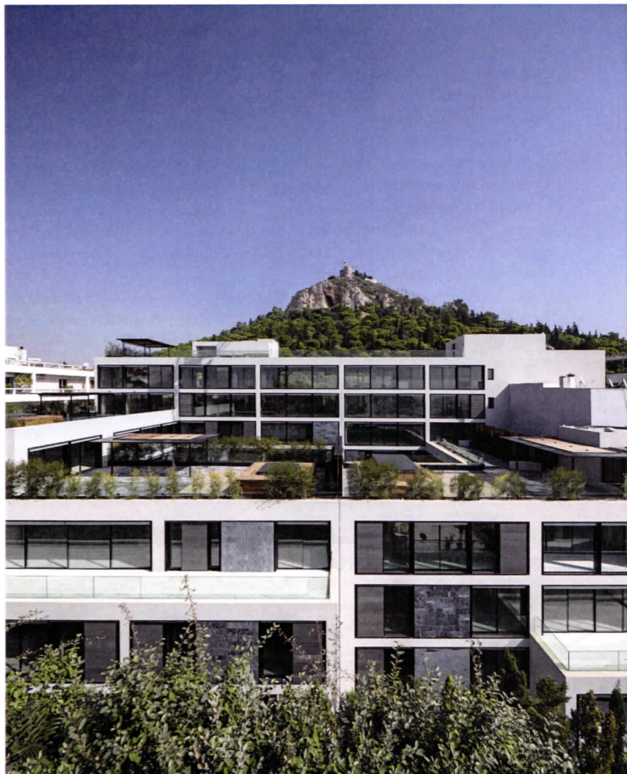
Εικ. 1 Άποψη από την οδό Στρατιωτικού Συνδέσμου.