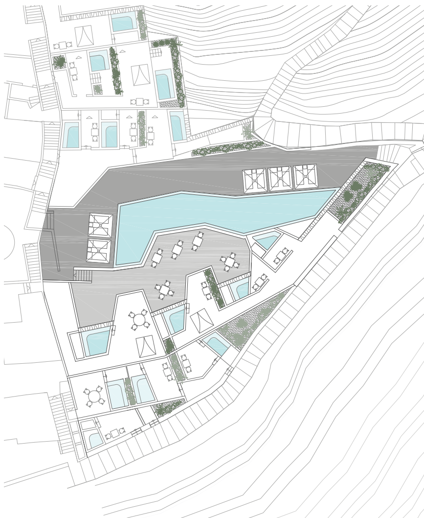
ΤΟΠΟΓΡΑΦΙΚΟ SITE PLAN