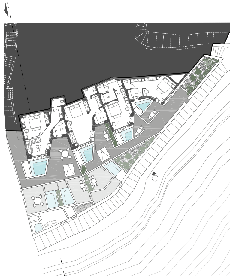
ΚΑΤΟΨΗ 2ου ΟΡΟΦΟΥ 2nd FLOOR PLAN