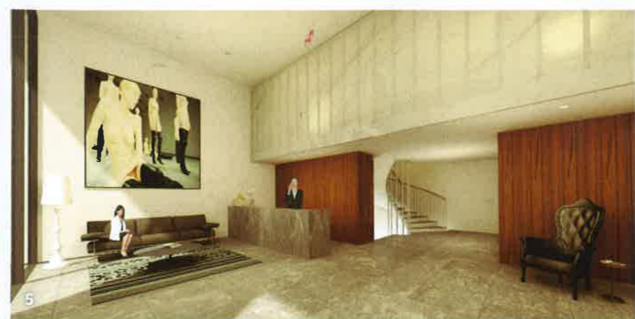
1. Το αίθριο με το μαρμάρινο δάπεδο, όπως και τα τέσσερα κλιμακοστάσια του κτιρίου και ο κήναβος, διατηρούνται ως βασικά χαρακτηριστικά του αρχιτεκτονικού σχεδιασμού.