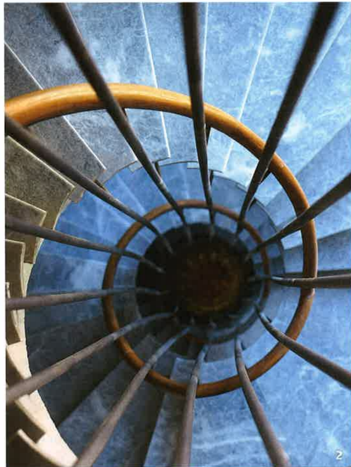
1. Πλήρως εξοπλισμένη σουίτα Business χωρητικότητας 14 ατόμων. 2. Το «πνεύμα Δοξιάδη» στη σχεδιαστικά συναρπαστική κλίμακα, η οποία διατηρείται όπως είναι.

Η μελέτη διατηρεί τα ιδιαίτερα αρχιτεκτονικά στοιχεία του κτιρίου, όπως το μαρμάρινο δάπεδο του αιθρίου αλλά και τα κυκλικά κλιμακοστάσια.