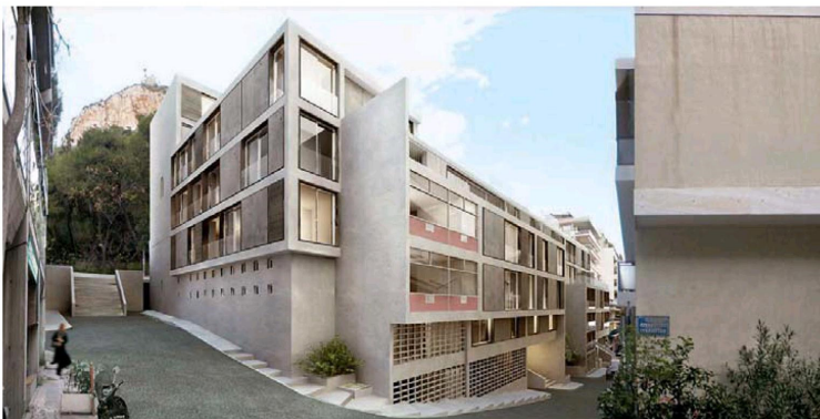
Στη συμβολή των οδών Στρατιωτικού Συνδέσμου και Λυκαβηττιού θα αναπαρασταθεί ένα τμήμα της αρχικής όψης του κτιρίου Δοξιάδη.

Την επομένη της απόφασης η ΜΟΝUΜΕΝΤΑ μπορεί να έβγαλε μια ανακοίνωση που ζήτησε από τον Παύλο Γερούλιάνο να μην υπονοηθεί η γνωμοδότηση του ΚΣΝΜ, αλλά τήν ίδια στιγμή άνοιξε