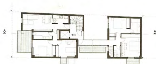
Κάτοψη Β' ορόφου