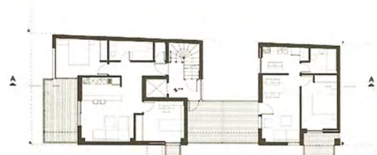
Κάτοψη Α' ορόφου